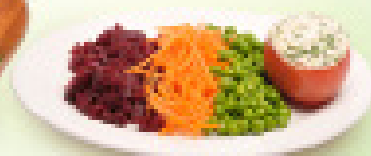
LÍNEA LIGHT ENTRETENIDA